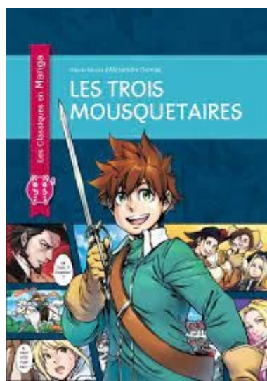
Les trois Mousquetaires Editions Nobi-Nobi