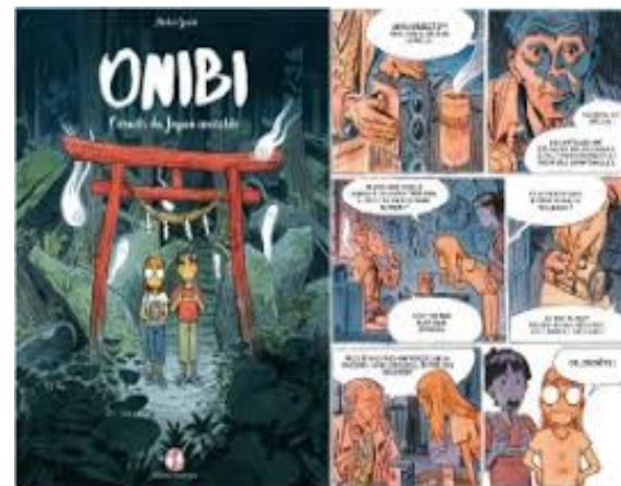
Onibi Cécile Brun